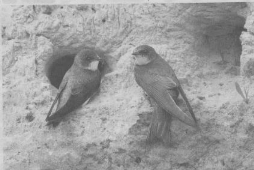
Een broedkolonie oeverzwaluwen heeft zijn intrek genomen op eiland 1 en 2 in Westergouwe. De bouwwerkzaamheden zijn tijdelijk stil gelegd.