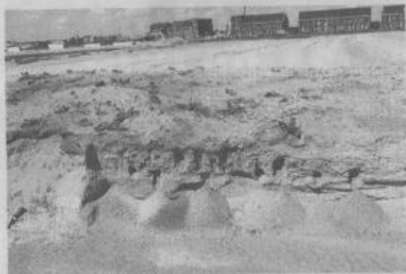
De oeverzwaluwen hebben in een klein laagje zand hun toevlucht gezocht.

voorkomen dat dit zou kunnen gebeuren. Omdat oeverzwaluwen kiezen voor steile wanden laten we standaard al het zand achter met een schuin talud. En dan vinden ze precies een laag zandwalletje op een plek waar gewerkt wordt." Op 10 mei zou de feestelijke eerste paal worden geslagen voor een serie woningen in Westergouwe. Op 9 mei werden proefpalen geslagen, waarbij de ecologen nauwlettend op het gedrag van de zwaluwen hebben gelet. "Unaniem werd geconstateerd dat de trilling verstorend werkt op de broedkolonie, dus het feestelijke was er wel vanaf toen de toekomstige bewoners hier een dag later stonden." De oeverzwaluwen zijn dus eigenlijk te vroeg neergestreken in Westergouwe, want als alle palen in de grond hadden gezeten, had de bouw gewoon verder kunnen gaan. "De zwaluwen hebben drie broedgangen. Tussen de broedgangen door mogen de nesten niet worden verstoord, omdat de zwaluwen altijd naar dezelfde plek terug komen voor de tweede en derde broedgang." Volgens Marien is het nog te vroeg om over de consequenties en eventuele schade uitsluitend te geven.