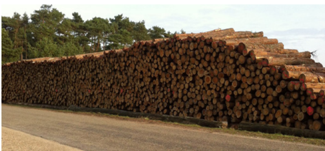
Goed gestapeld, maar wél te dicht bij de weg!