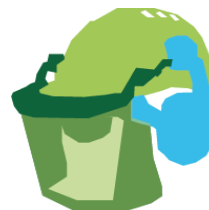
Veiligheidshelm inclusief gehoor en gelaatsbescherming